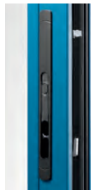
Poignée encastrée (Existe aussi en teintes RAL)