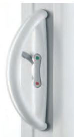
Poignée demi-lune POCA (Existe aussi en teintes RAL)