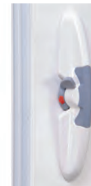
Poignée PICA (Existe aussi en teintes RAL)