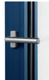
Poignée CAD84 (Existe aussi en blanc)